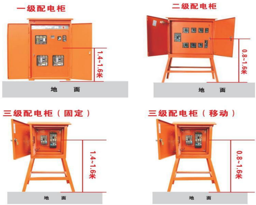
配电柜橙红色色值: C M60 Y100 K

(1) 一级配电箱箱体采用橙红色颜色。配电箱装设在橘红色的支架上。一级配电箱的中心点与地面的垂直距离应为 1.4~1.6m。橙红色色值 C0 M60 Y100 K0